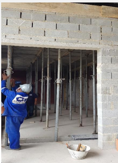
Construção de subestação Projetos/Instalações