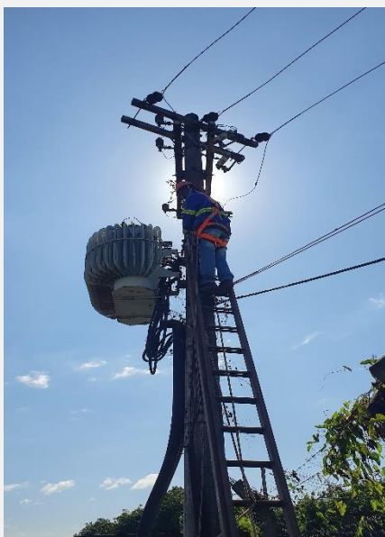
Instalação de transformadores/ensaios