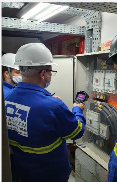
Laudos Técnicos Termografia