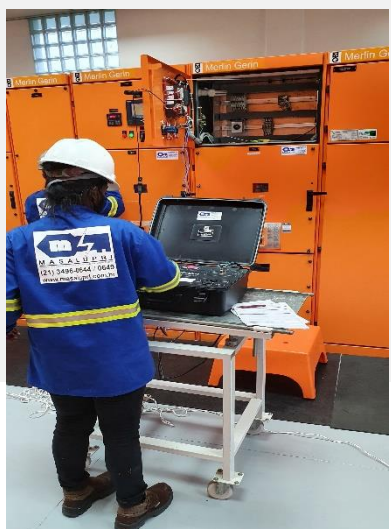
Ensaio elétrico e Comissionamento técnico