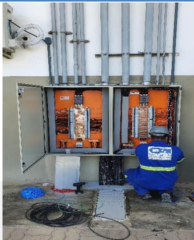
Retrofit de painéis/quadros elétricos