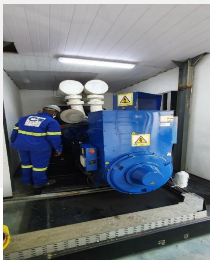
Manutenção de geradores