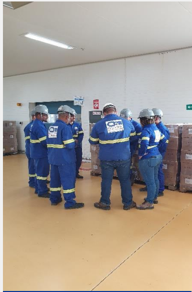
Planejamento Masalupri DDS